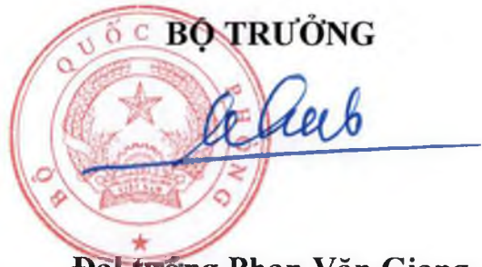
Đại tướng Phan Văn Giang